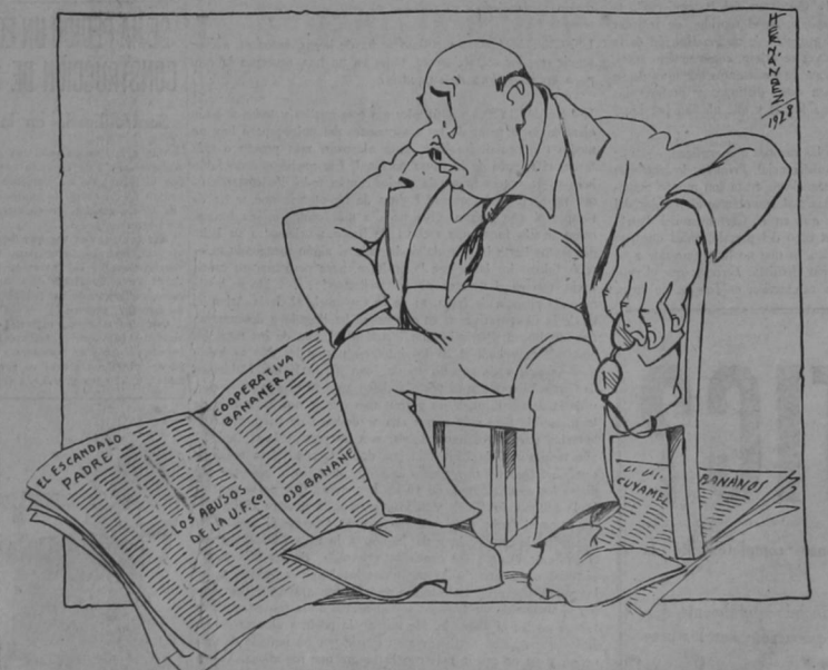
¡Ya estoy viendo que es mejor negocio escribir sobre bananos que sembrarlos!!